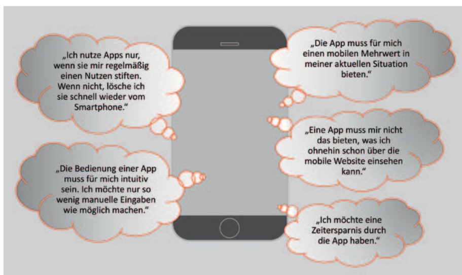
Abbildung 2: Kunden erwarten von einer App Zeitersparnis und Mehrwert .